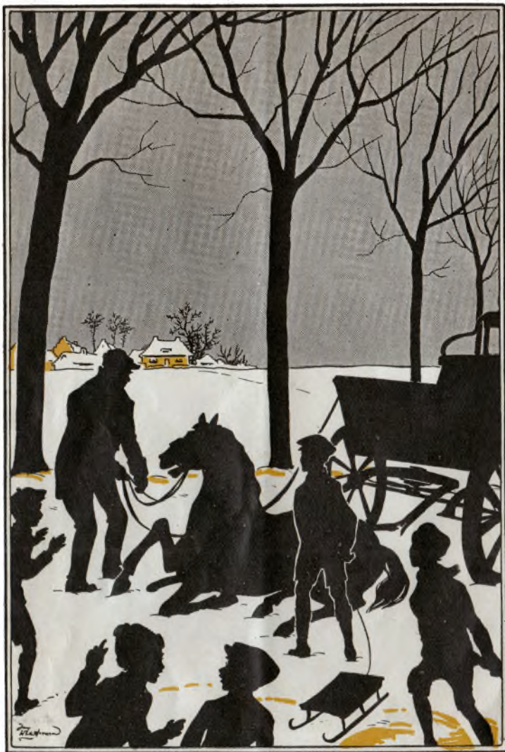
Het vermoeide paardje viel om in de sneeuw, ———— [Blz. 8]