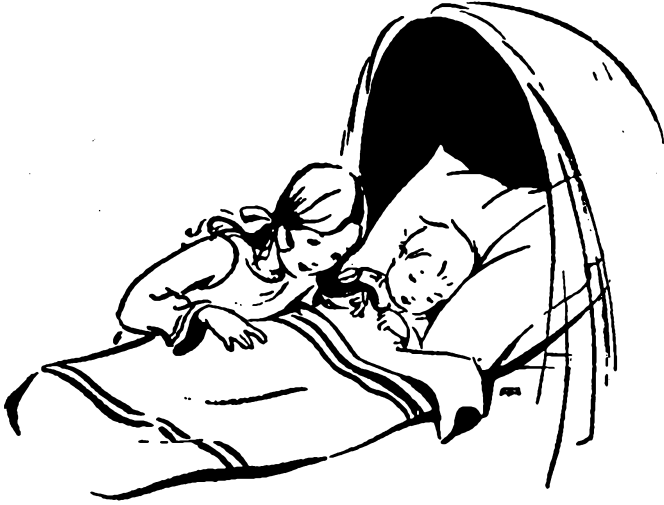
en aaide er mee over het dikke knuistje van zus.

De eerste keer vond zus het een beetje griezelig, maar langzamerhand begon ze te grijpen naar de blonde haarpruik van Joske.