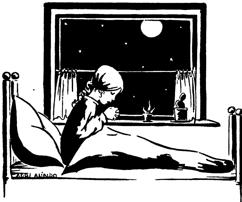
Eerbiedig vouwde Joeske haar handen.

Eén ding was nog jammer — dat vader en moeder nog niets wisten.