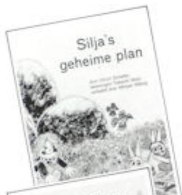
Olav Schaffel 42 Silja's geheime plan

De kleine Silja woont in een dal vol groene weiden, hoge bomen, veel bloemen en een riviertje. Silja vindt het fijn om in het dal, dat ook een beetje háár dal is, te spelen. Maar de mensen maken van het dal een troep. En samen met de dieren en de bomen bedenkt Silja een plan om de mensen te laten zien dat het zo niet door kan gaan.