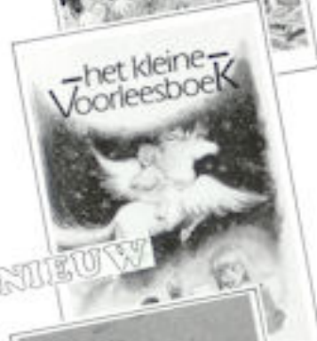
Ria Valkenburg (red.) 43 Het kleine voorleesboek

32 blz. geïll. groot formaat. geb. f 10,75