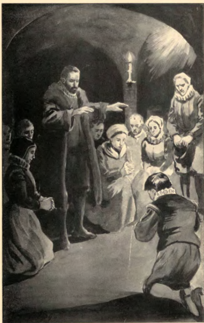
Vervolgens breidde de predikant zijn handen uit over den kleinen kring.