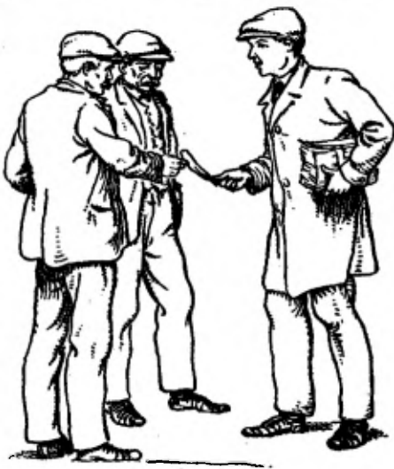
Hij stak er den metselaar een toe.

Kneuterdijk liep, naar huis, kwam 'n werkman naar hen toe, die 'n bundel biljetten onder de arm droeg. Hij stak er den metselaar een toe — die, zonder te weten, wat de inhoud ervan was, het aan-