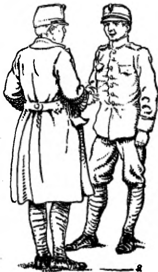
De Fries zag verrast op.

„'t Is te hopen — ik ben maar een arme soldaat,” lachte Rinus, maar tante zei zuinig: „Ieder dubbeltje is er een, jongen, denk er om.”