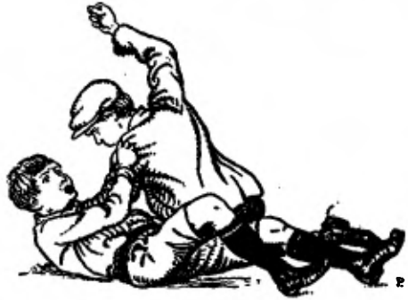
Twee jongens vechtend over de grond.

Eer de anderen goed en wel wisten, hoe 't gebeurd was, rolden de twee jongens vechtend over de grond. Leo zei geen woord — z'n lippen had ie vast oopengeperst, maar z'n vuisten deden hun werk. Met de linkerhand had hij z'n tegenstander bij diens das gegrepen — knelde die nu stevig vast . . . . Z'n rechter gebruikte hij om te slaan — overal waar hij raken kon . . .