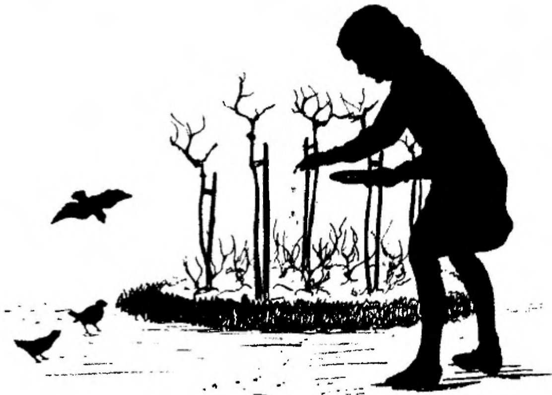
Proeve van illustratie uit „De Nieuwe Zondagschool-Serie”.