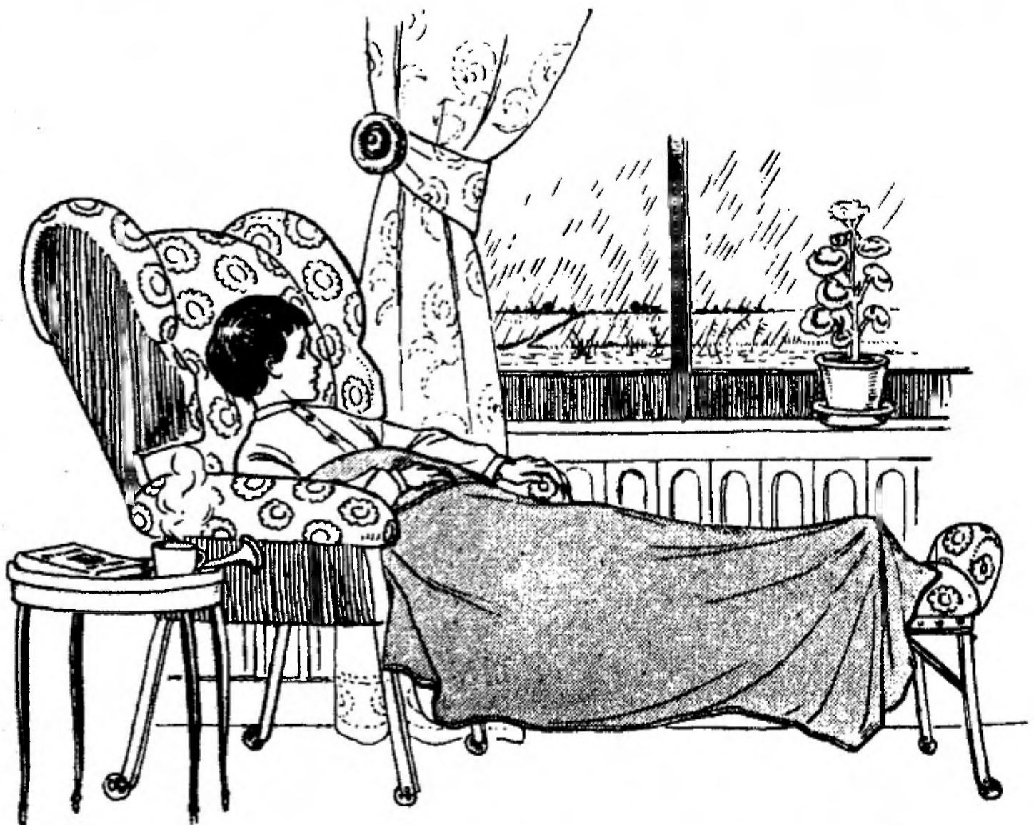
Proeve van illustratie uit: „De Nieuwe Zondagschool-Serie”. No. 11.

Bij afname van minstens 10 stuks (gesorteerd) 15 % korting.