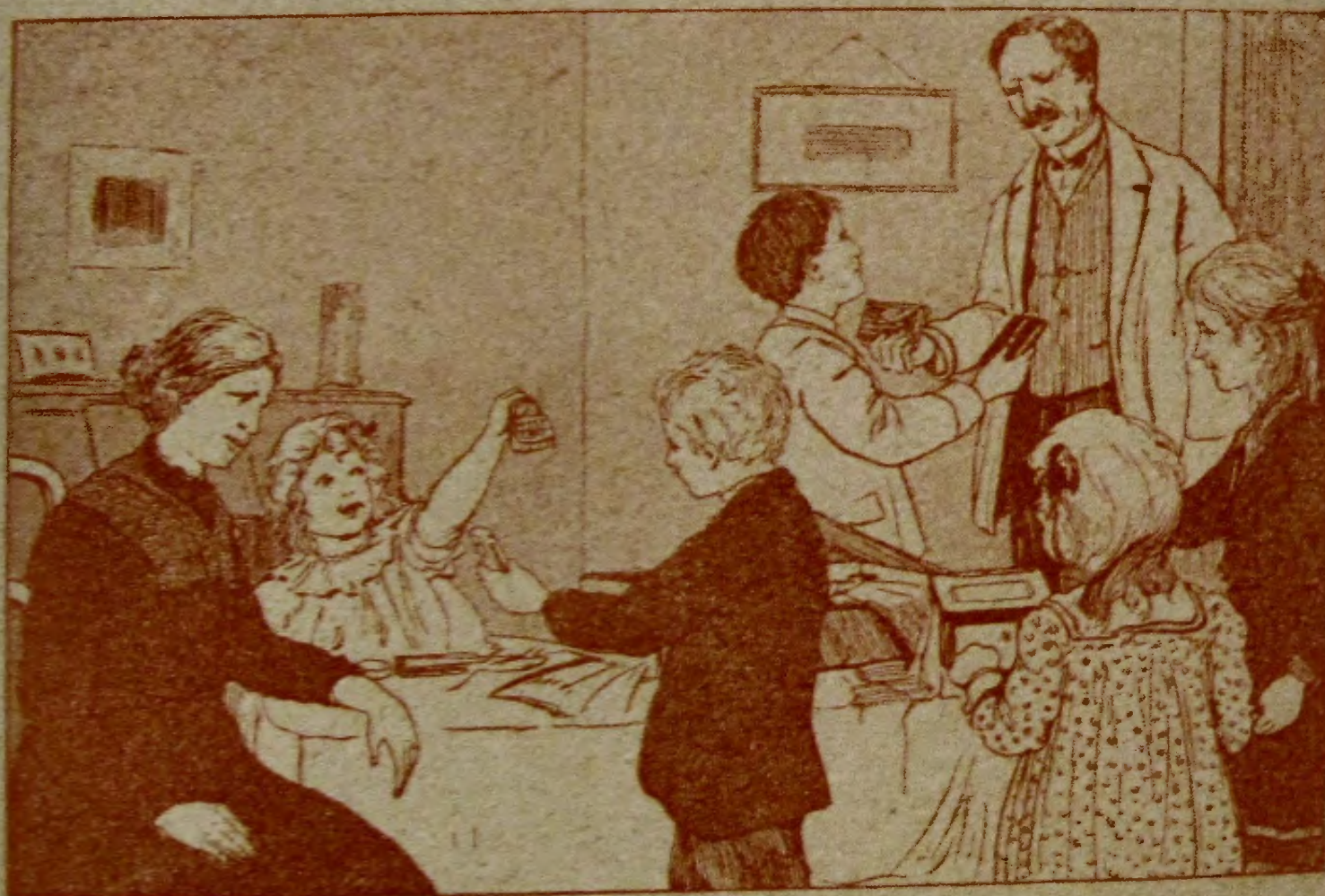
Proeve van illustratie uit „Mijn Bibliotheek”.