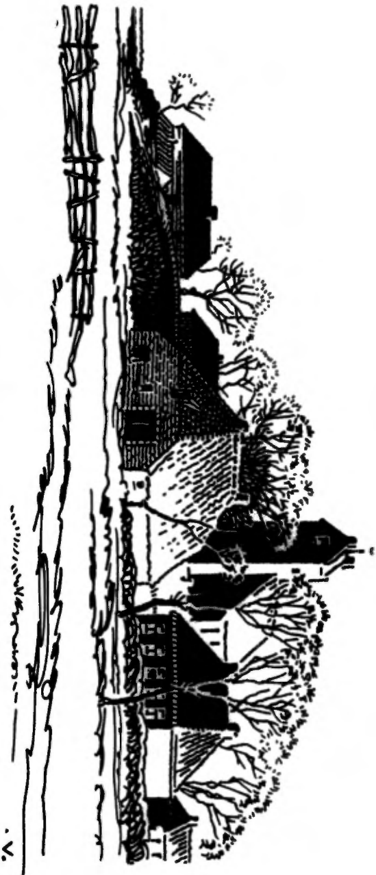
.....ligt het kleine Terpdorp.....