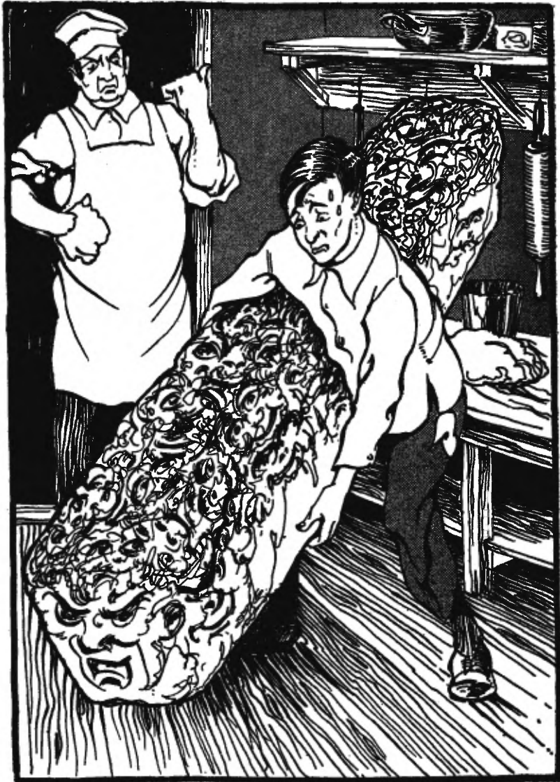
Hij moest een heel groot brood wegbrengen.