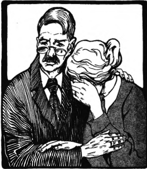
Snikkend leunde ze tegen hem aan.

duren, of ze zou weten, waardoor het kwam, dat Herman zoo laat was. Zij nam eenig naaiwerk ter hand. 't Was Hermans witte jas, waaraan ze iets moest