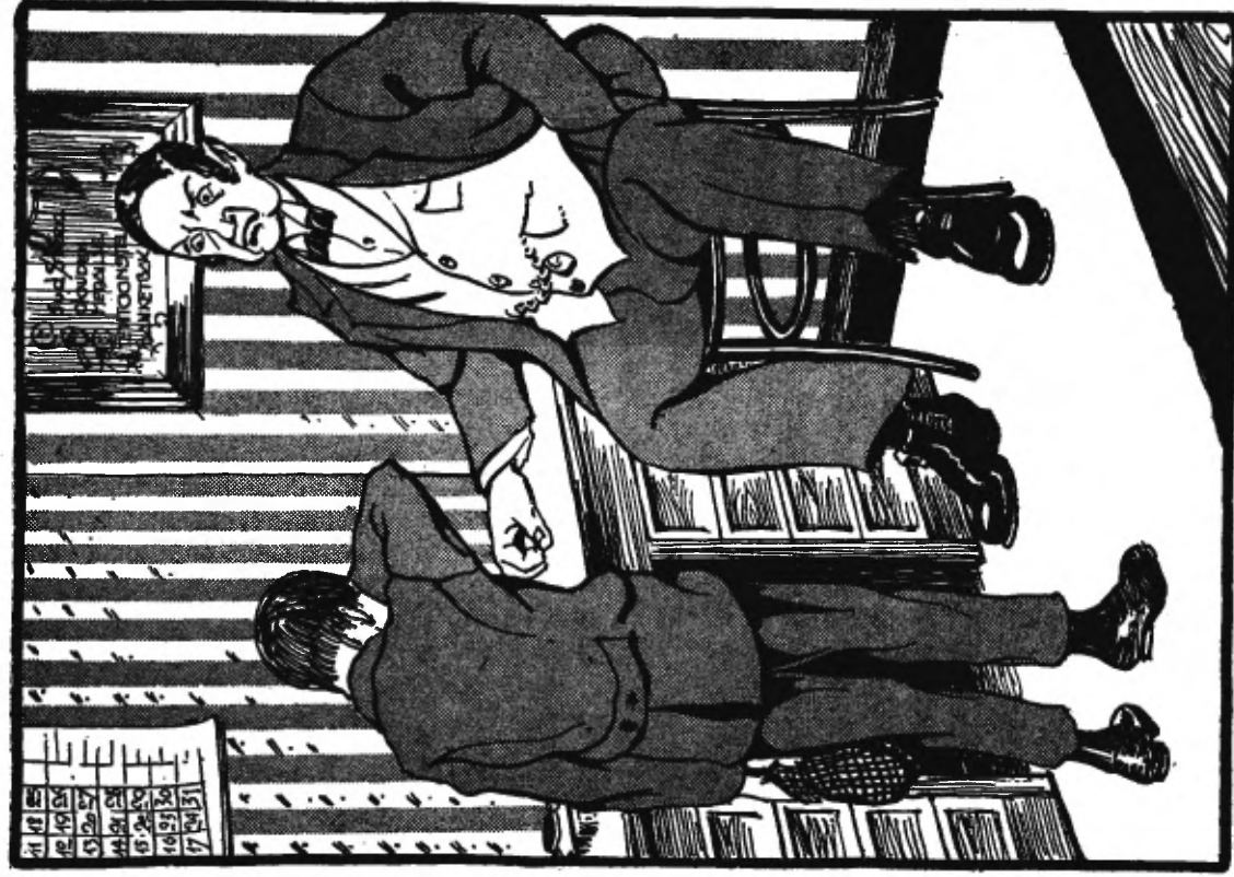
Herman barstte in tranen uit.