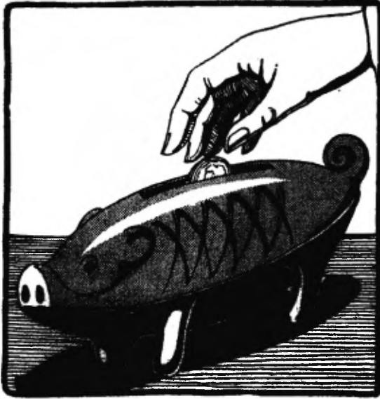
Zorgvuldig had hij zijn kwartje opgeborgen.

Want zou mijnheer dan niet vragen, hoe het kwam, dat hij niet dadelijk had opgegeven, dat mevrouw dien middag niet betaald had? En dan daarbij, mevrouw van Hemert was geen dagelijksche klant. Als hij nu het geld bij elkaar had, en hij moest geen bestelling bij haar brengen, hoe zou hij dan kunnen