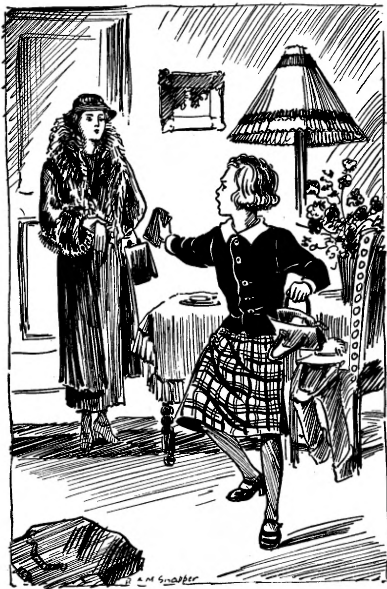
Gusta stampte van boosheid en lang bedwongen drift op de vloer.