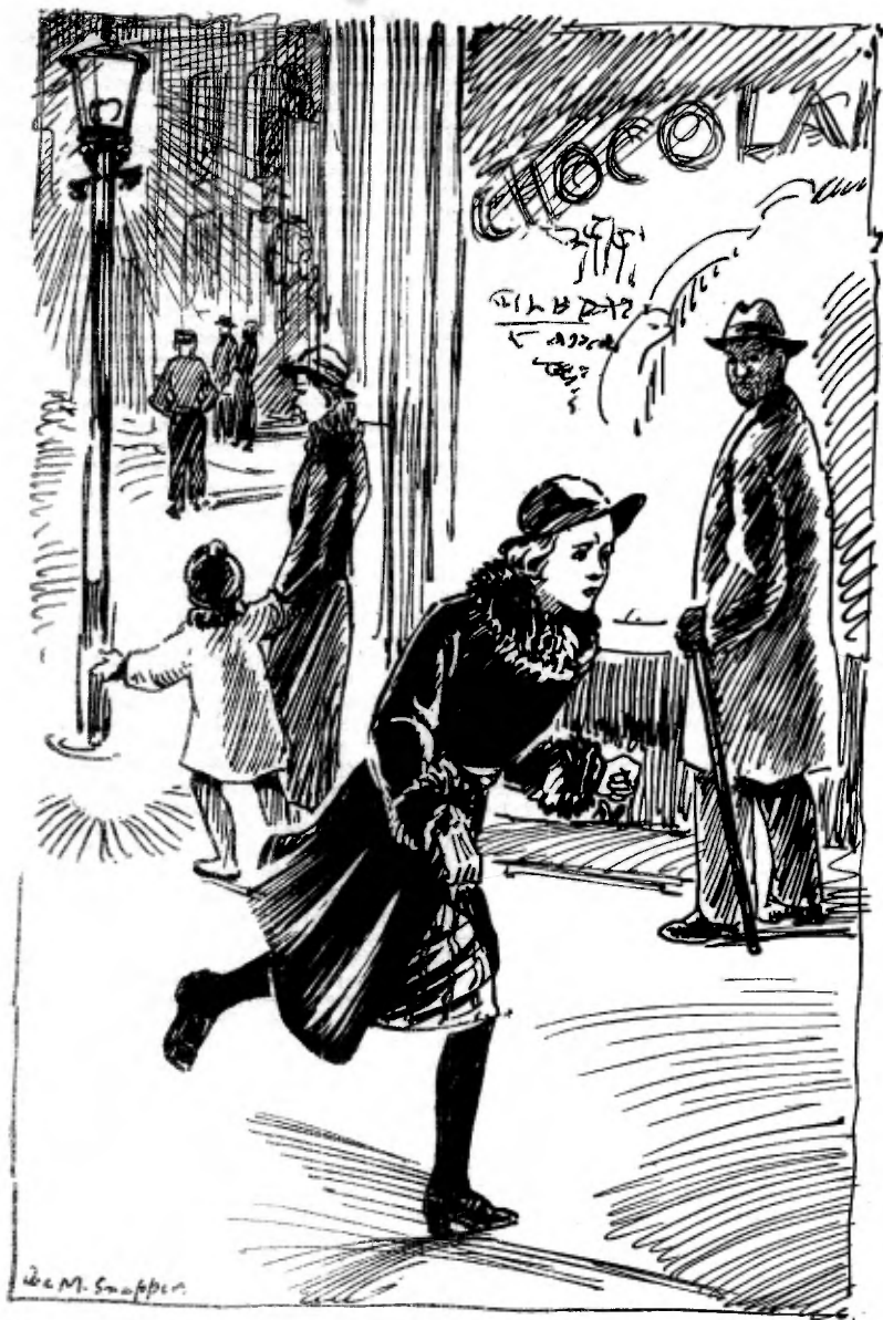
Zonder om te zien snelde ze voort.