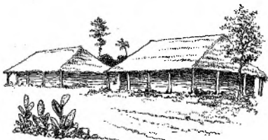
School en onderwijzerswoning.