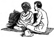
Naast hem, op een uitgerold matje, zat de zending.

Kinderen hebben haast en kakelen als verschrikte kippen,