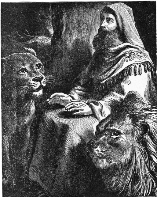
Daniël in den leeuwenkuil.