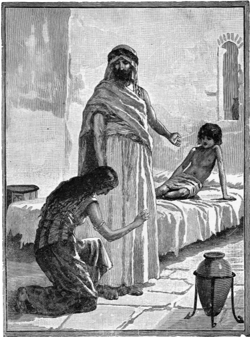
Aan de moeder teruggegeven.