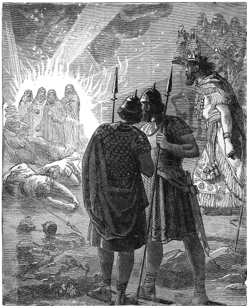
In den vurigen oven.