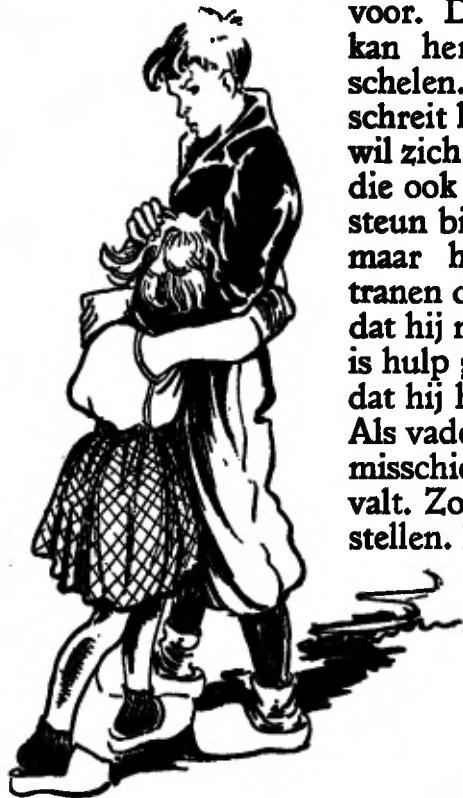
Hij wil zich flink houden voor Wiep.

vreest het ergste. Als dokter de deken wegneemt en er aanstalten gemaakt worden om vader in huis te brengen, zoekt hij ongemerkt weer het stille plekje achter het huis op, waar de konijnen ongeduldig met de poten tegen de ruif slaan. Maar daar heeft hij nu geen oog