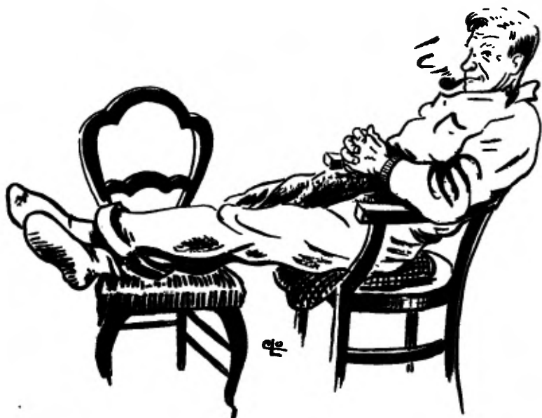
Jonge, vader is al thuis.

Wat zou er komen? Hij heeft geen oog van z'n vader af, alsof de woorden op diens gezicht te lezen staan. Maar vader verlegt eerst nog eens zijn been, blaast dan bedachtzaam een wolk tabaksrook naar de zolder en zegt dan kalm: „Nou, van mij mag het wel!”