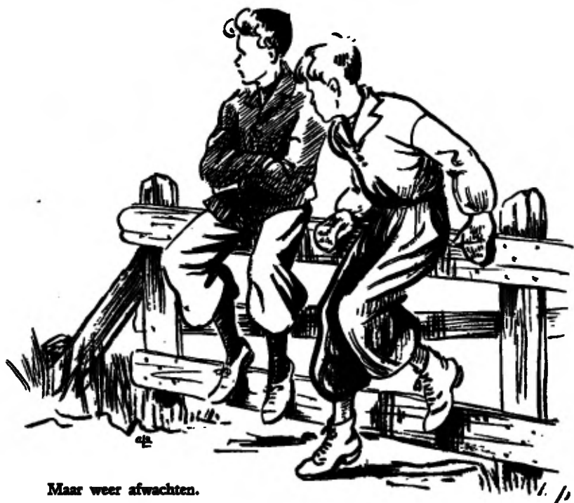
Maar weer afwachten.

na en slenteren dan naar de brug, waar ze op de leuning gaan zitten. Maar weer afwachten!