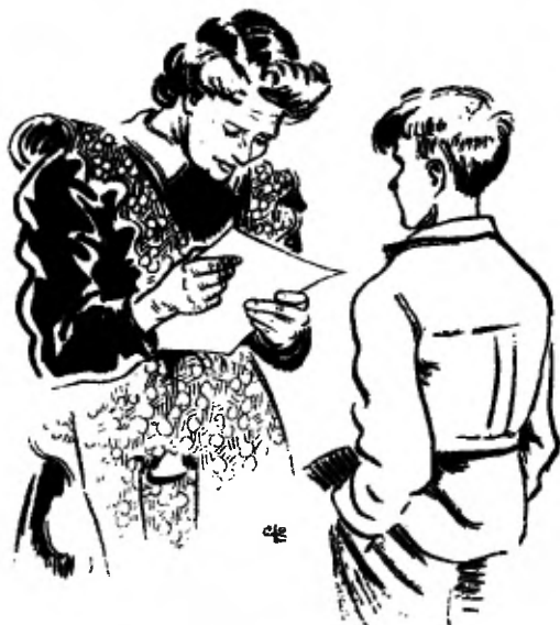
Moeder raakt er bijna niet over uitgepraat.

Met een speld hecht hij de tekening aan de wand. Het eerste schilderij!