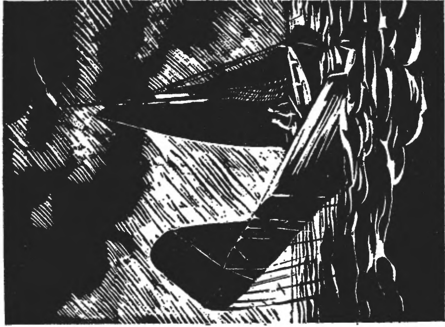
W takstikken stikken mit zee op.