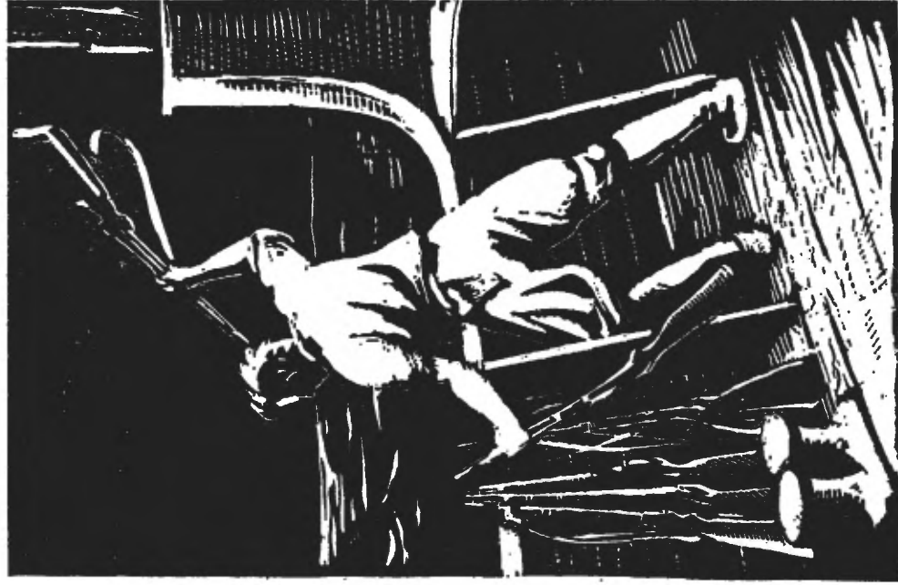
De overige wapens gooit hij een voor een in zee.