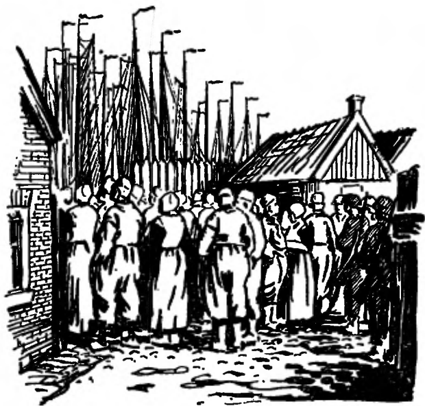
Aan de haven is het zwart van volk.

De Duitsers komen aan boord, van botter op botter stappend. Op de kleine schuiten blijven zij niet lang, maar op de grote nemen ze alles op en dan vorderen zij de beste schepen: de 109 van Dubbele de Vries, de 58 van Riekelts Brouwer, de 204 van Louwe Kramer.