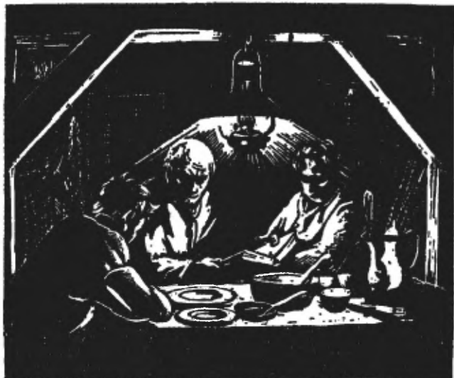
In het kleine voorondertje neemt Gnodde de bijbel...

Daarna legt hij zijn hoofd rustig op het kussen van zijn kooi. In Gods bescherming zijn hij en zijn jongens veilig, al zouden er ook duizend bommen vallen.