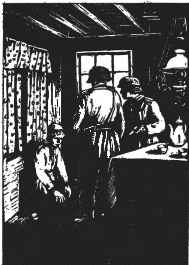
Evert kruipt onder de bedstee uit.