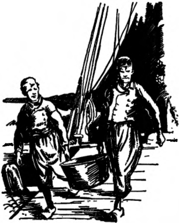
...twee vissers, die zwaar aan een kuip paling sjouwen.

moeten er zijn,' hadden ze uitgeroepen. 'Zoek dan maar!' had Gnodde hun geraden. Ze hebben gezocht in de vooronders, in de kooien, onder de laningen, zelfs in de bunnen wilden ze gaan zoeken. 'Nou heb je ze,' had Gnodde toen gespot. 'Waterrotten zitten onder water.' Op Marker en op Lemster botters waren ze gaan zoeken om te zien of daar de gladde Urkers zich verscho- len hadden. En eindelijk hebben ze zich herinnerd dat verschei- den jongens kuipen met paling hadden weggesjouwd. 'Waar zijn die knapen toch gebleven?' hebben ze gevraagd. Maar ieder hield zich van den domme en woedend zijn de Groenen eindelijk weg- getrokken.