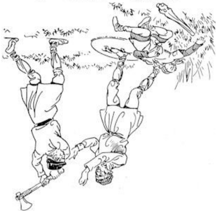
Illustratie uit „Skaldi, de jonge Noorman“.