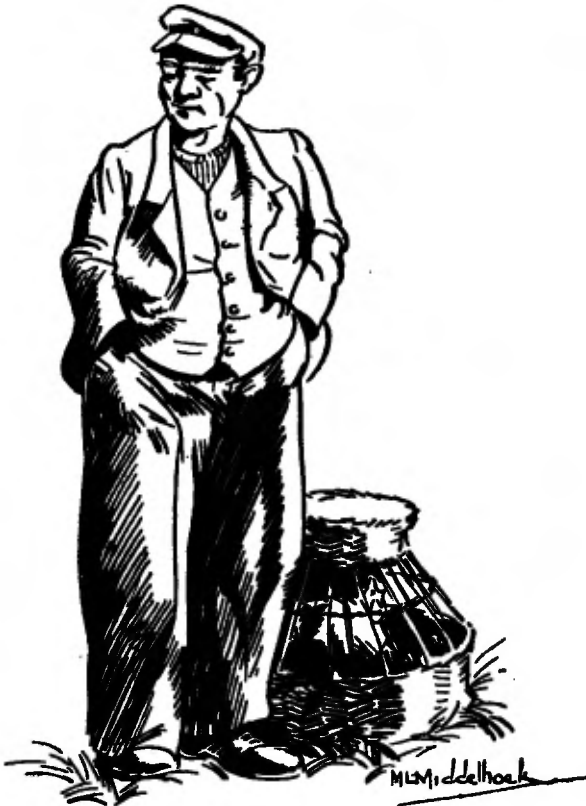
Dat komt van de beleefdheid, zeggen de mensen.

Want ze weten wel, dat Went voor niemand z'n pet afneemt, zelfs niet voor de burgemeester of de dominee.