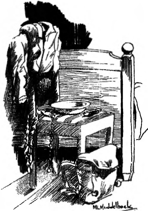
Op de stoel naast het bed liggen uitgestald al de kostbaarheden voor het kamp.

Ze houden zo veel van hun goede, eerlijke jongen. Ze willen zo graag hem een pleziertje doen.