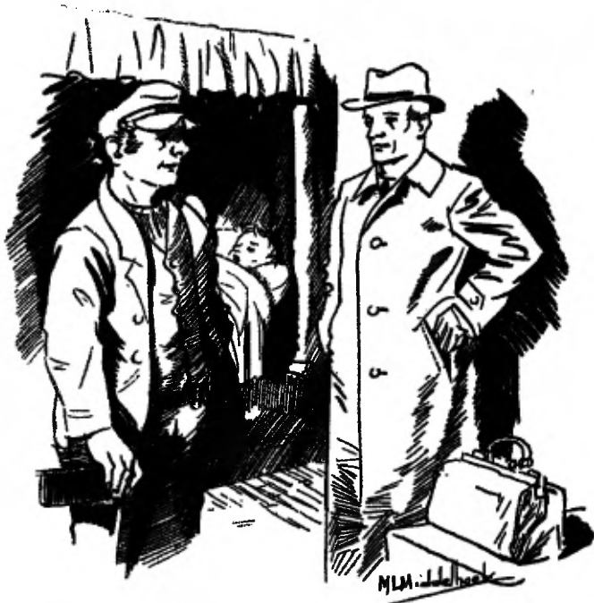
Deze knaap mag niet vervoerd worden.

Straks zal hij een veldbed spreiden op de grond. Daar zal hij slapen vannacht.