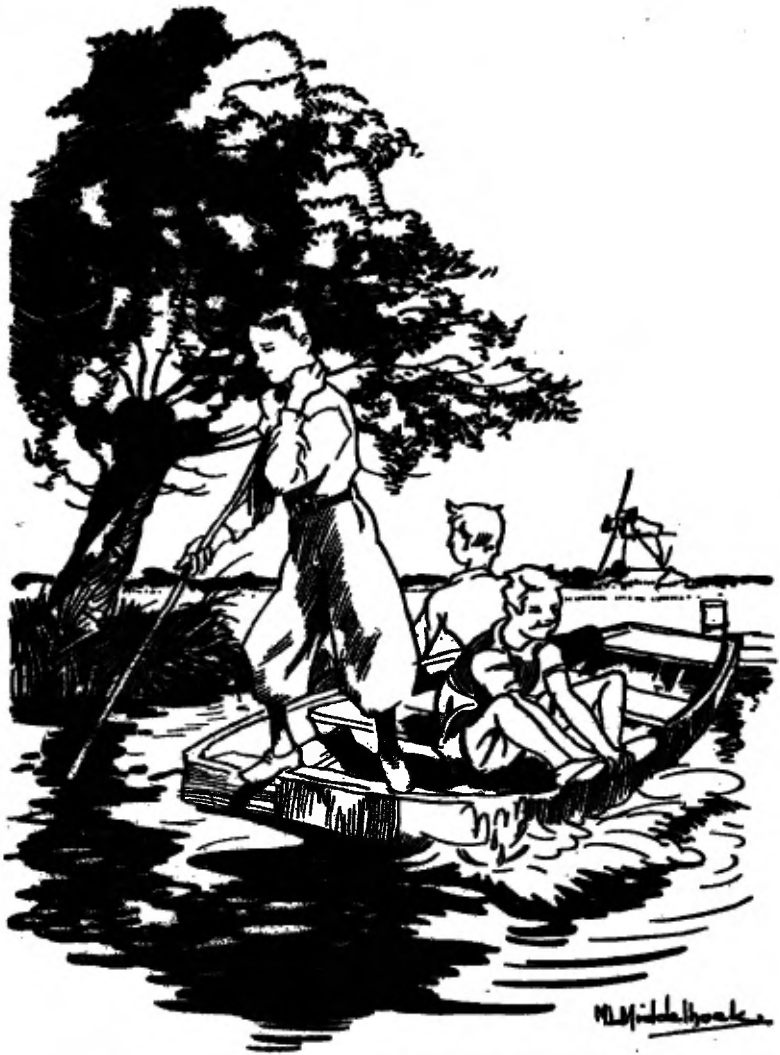
WIRBELEN DE JONGENS MET DE SCHUIT (blz. 12).