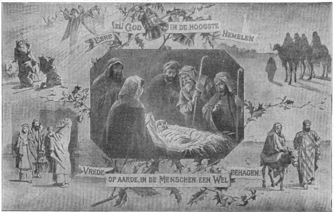
Verkleinde afdruk van de Kerstplaat van Steelink, vermeld op pag. 13.