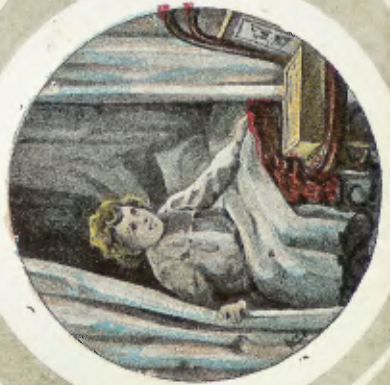
Proeve van illustratie.