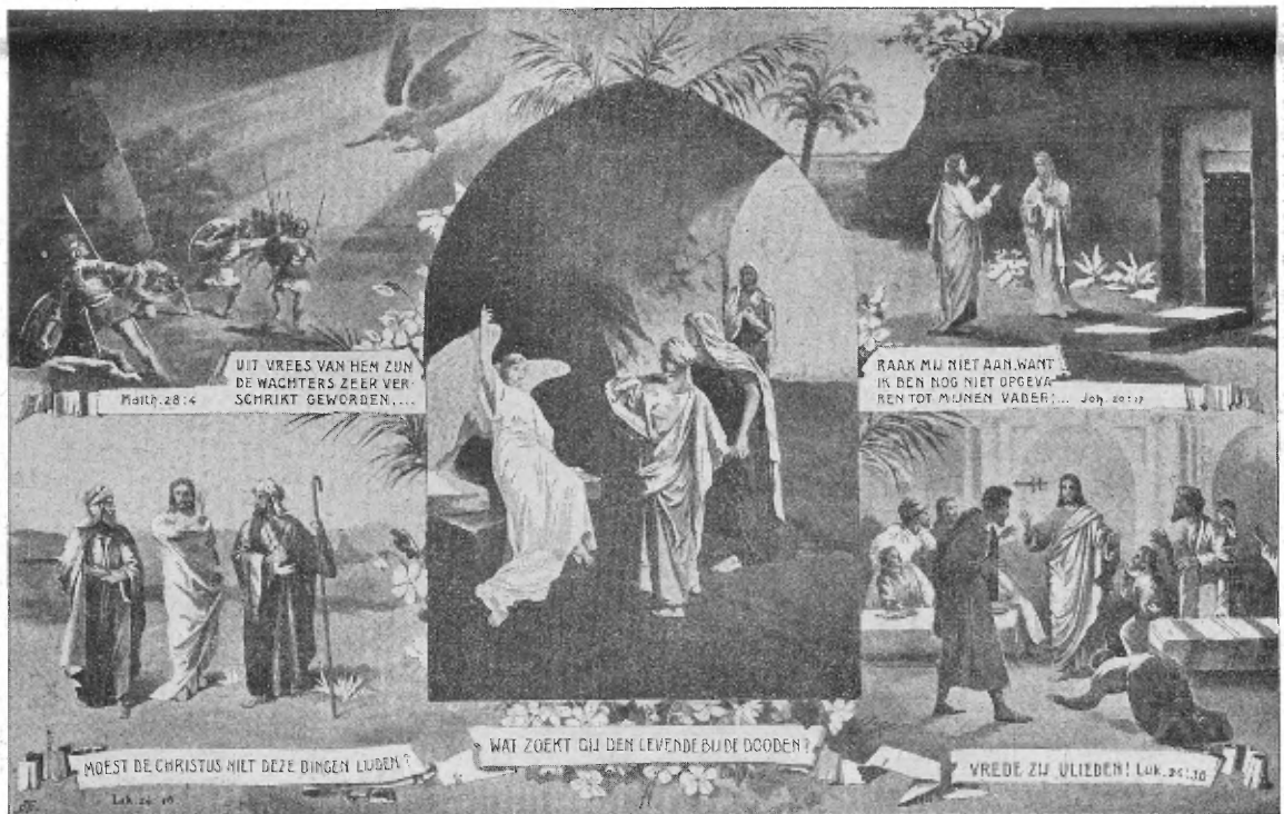
Verkleinde afdruk van de Paaschplaat van Rünckel, vermeld op pag. 13.