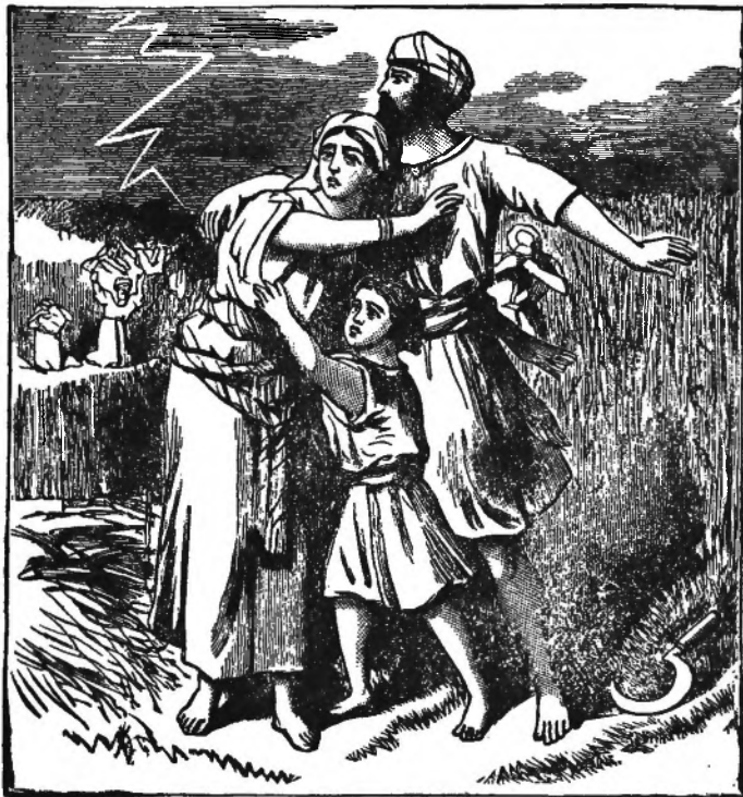
HET ONWEER TIJDENS DEN OOGST.

Is 't vandaag niet de tarwenoogst? Ik zal tot