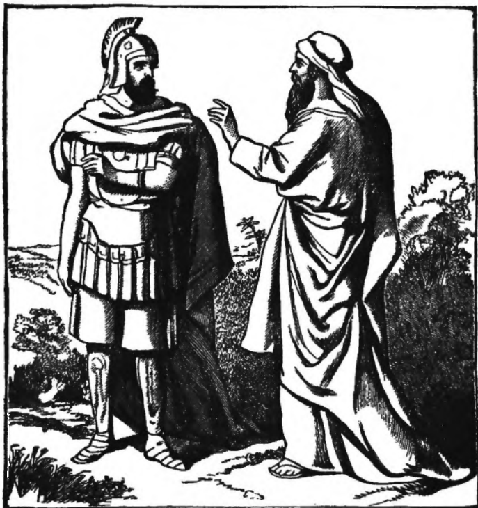
SAMUEL BESTRAFT SAUL.

Saul geen waar berouw had van zijn zonde, maar dat 't hem alleen speet om de gevolgen.