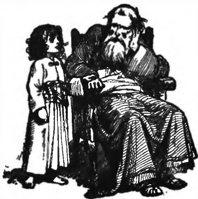
SAMUËL EN ELI.

Vroeg in den morgen stond Samuël op. Hij zette de deuren van den tabernakel open en deed de lamp uit, die er 's nachts altijd brandde. Dit was zijn gewone morgenwerk.