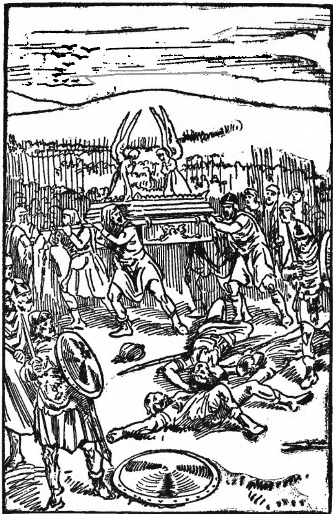
DE ARKE WORDT GENOMEN.