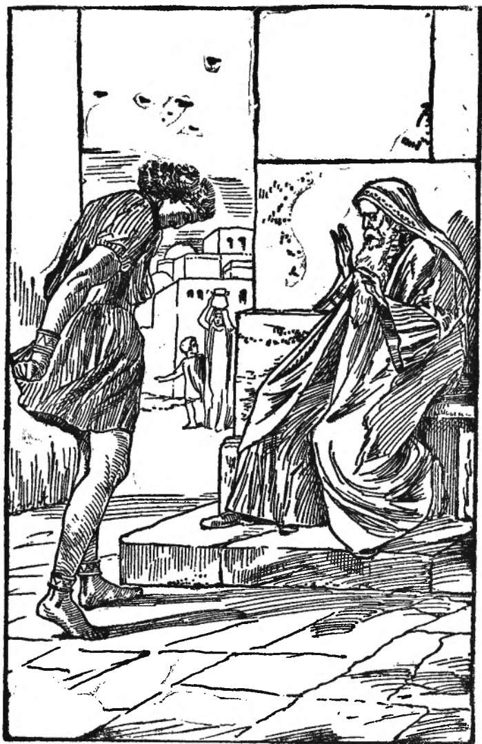
DE BENJAMINIET VOOR ELI.