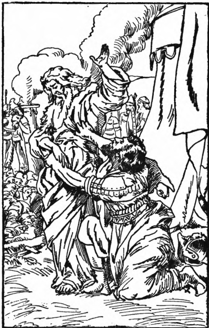
SAUL GRIJPT SAMUELS MANTEL.