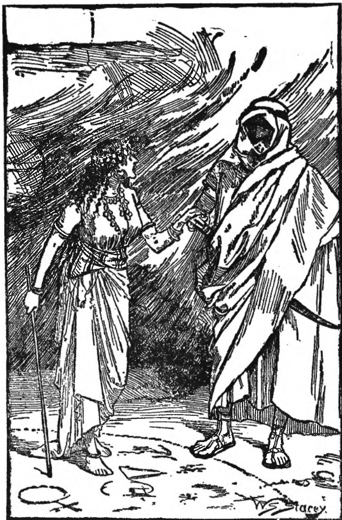
SAUL EN DE WAARZEGSTER.