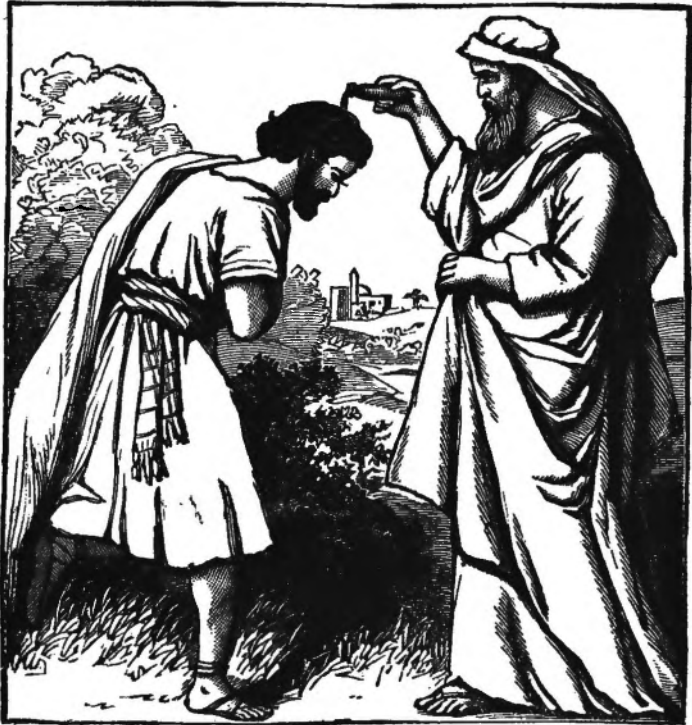
SAMUEL ZALFT SAUL TOT KONING.

gedaan had. Daar kunnen we uit zien, dat Saul bescheiden was.