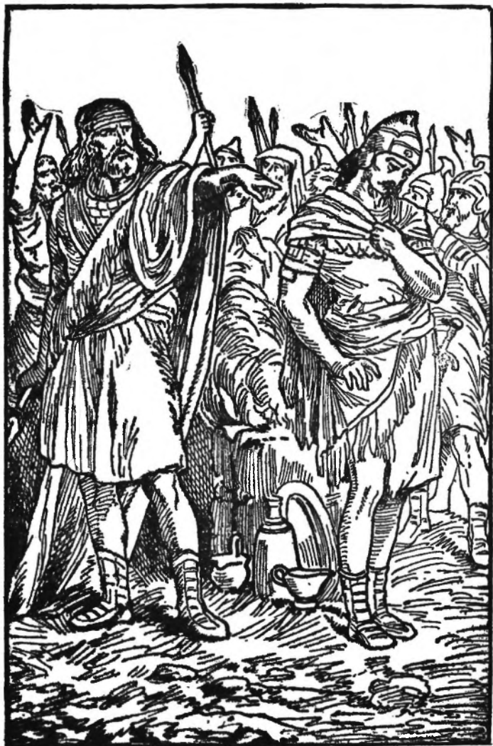
SAUL VEROORDELT JONATHAN.