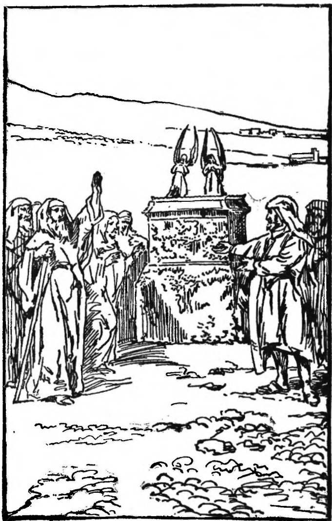
TERUGKEER VAN DE ARK.