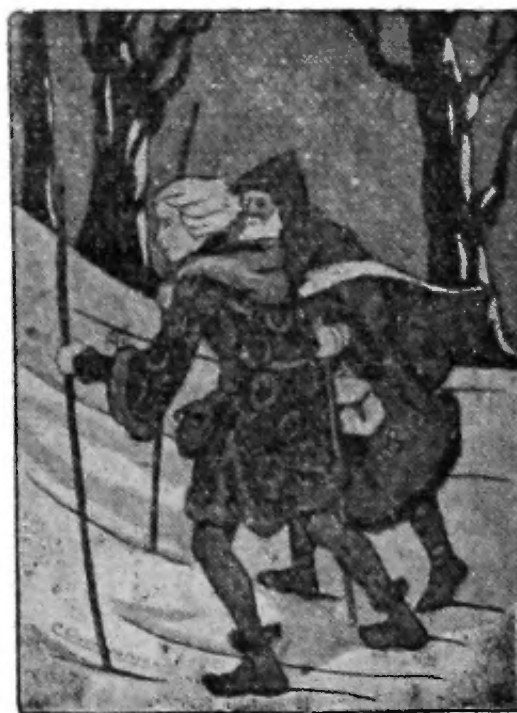
De vreemdeling der valeien.