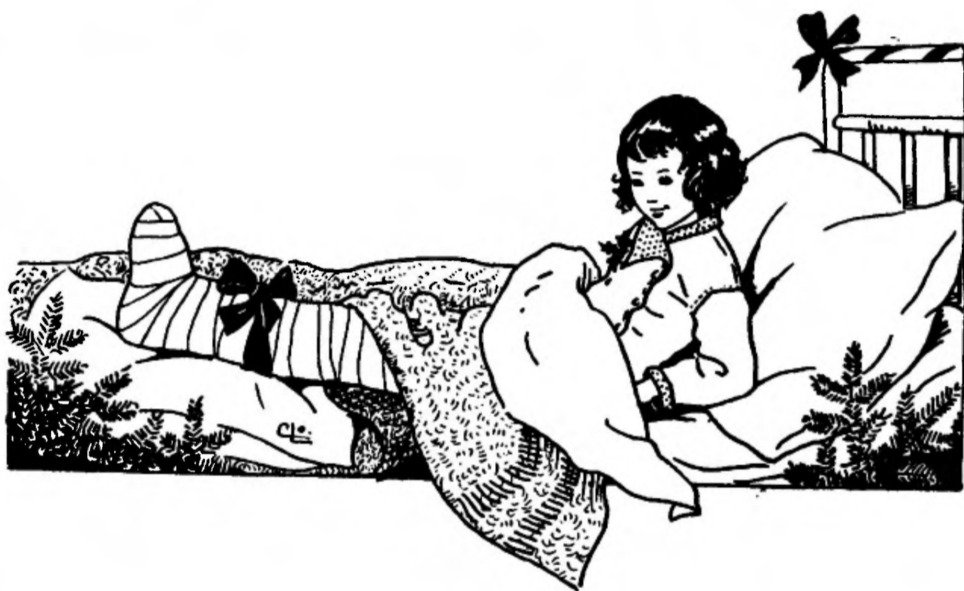
Illustratie uit: „Zonneke”.