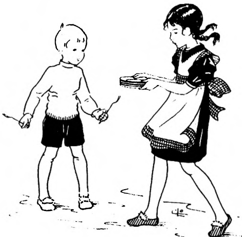
Illustratie uit: Ons Kerstkindje.