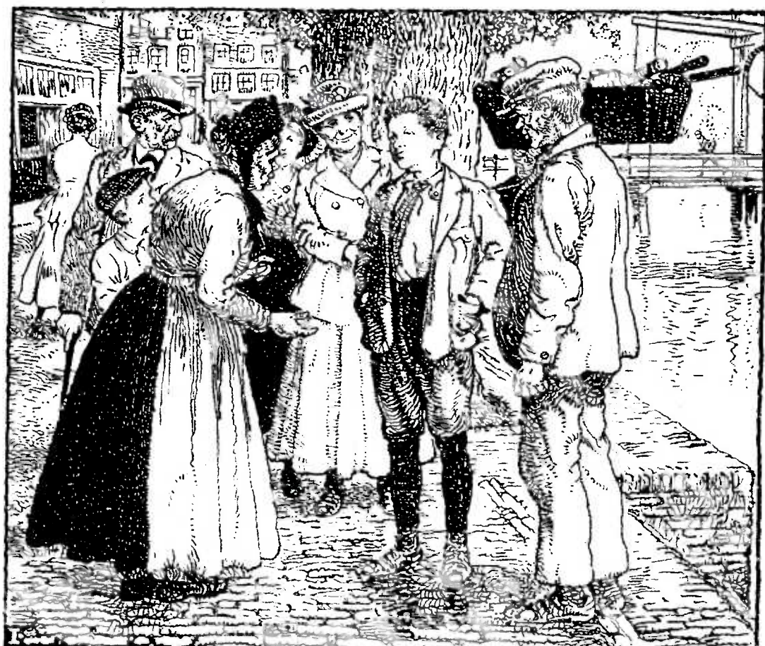
illustratie van Isings uit Goede Vrienden deel 1, bl. 75

J.H. Isings, de bekende huisillustrator van uitgeverij Wolters, zou plaatjes voor de serie maken. Maar De Mérode wilde hem niet. Isings tekende 'veel te koud', vond hij. Hij stelde enkele anderen voor: Rie Cramer, Tjeerd Bottema.