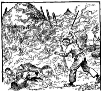
Tekening van Henk Polder voor „Toen de ketsaars in het schuurtje brandaal” door A. C. van der Mast.