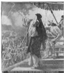
Samuel waarschuwt Saul en het volk

Aan Hoofden van Zondagscholen, Chr. Scholen en bewaarscholen, die wel eens prenten onder de jeugd uitdeelen, wordt op aanvraag een van deze prenten gratis en franco toegezonden.