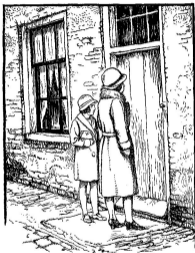
Tekening van Hendr. Ponder voor „Gerd's nieuwe mantel" door Peetina