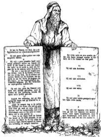
Dere kaart, gedrukt op mooi blank ivoor-carton, is bijzonder geschikt om onder de heiligen uitgedeeld te worden, waardoor het leeren der TIEN GEBODEN in de hand gewerkt, en dus het onderwijs zeer bevorderd wordt. Prijs per ex. 5 ct.; 25 ex. 4 ct. per ex.; 50 ex. 3 ct. per ex.; 100 ex. 2 ct. per ex.