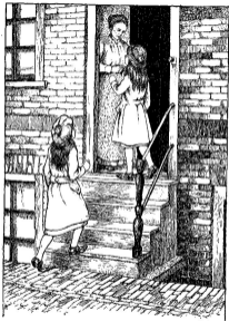
Tekening van Henk Polder voor „Tritje” door Geina Ingwersen.