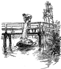
Tekening van Hink Ponder voor „Het vierpunt“ door D. Meukow—van der Spiegel.