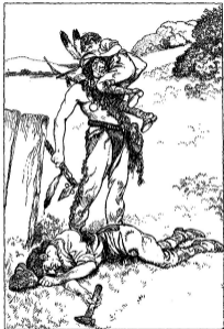
Totkasting van lings voor „Hoe de zoon van den pionier president werd“ door A. C. de Zwart.