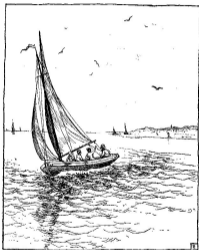
Tekening van Henk Polder voor „Trots Mastless” door Francisca