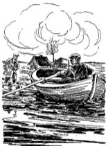
Teekening van Aantje van de Ruit voor „Dappere Haas“ door Heleen