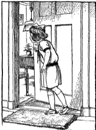
Teekening van Henk Doeder voor „Grootmoeder's ring" door Wilho. Riem Vis