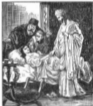
De opwekking van het doekwiltje van Jezus

Honderd en eenste tot Honderd en vijf en twintigste deukmètal