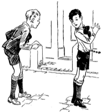
Tekening van Annie van de Raai voor „Peuk bij grootvader” door J. H. Hutteman-Schippers