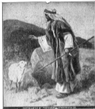
Het verloren schaap

Deze serie bestaat uit 15 pakjes, die de volgende onderwerpen behandelen: