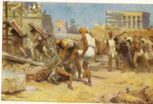
16. Israël in dienstbaarheid