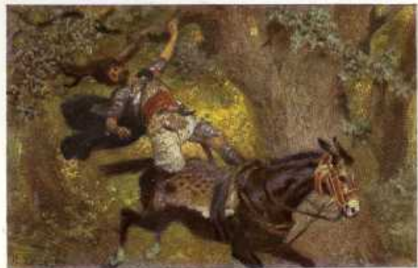
43. Absaloms dood