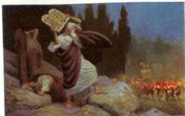
22. Mozes verbreekt de steenen tafelen