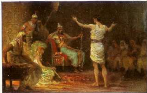
13. Jozef verklaart Farao's droomen