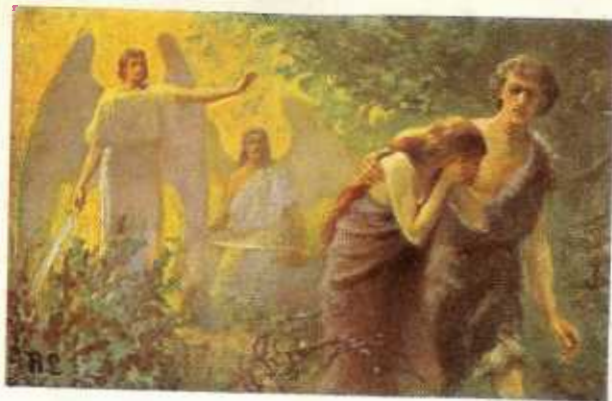
1. Adam en Eva uit het Paradijs verdreven