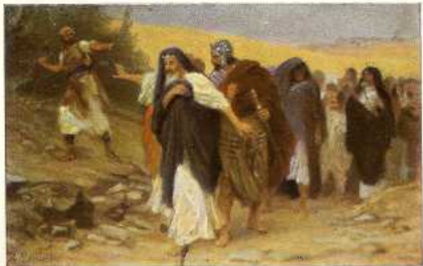
41. David vluchtend voor Absalom