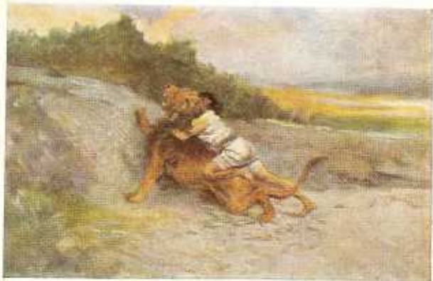
31. Simson verscheurt een leeuw