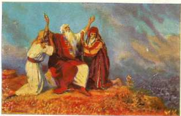
21. Mozes bidt, gesteund door Aäron en Hur