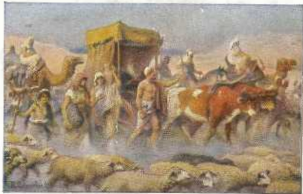
15. Jakob trekt af naar Egypte