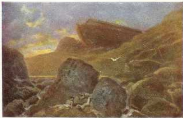
4. Na den Zondvloed