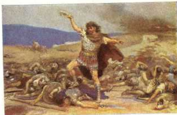
32. Simson verslaat de Filistijnen