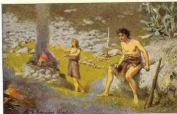
2. De offerande van Kaïn en Abel