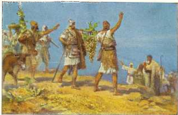
23. De verspieters keeren terug