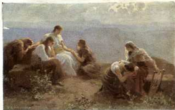
30. Het afscheid van Jeftha's dochter