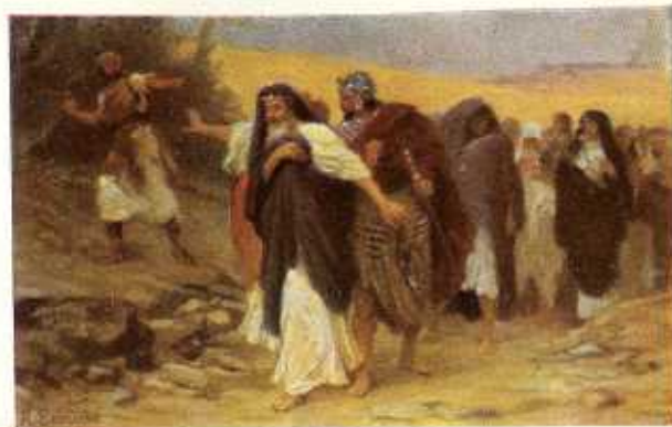
42. David vluchtend voor Absalom