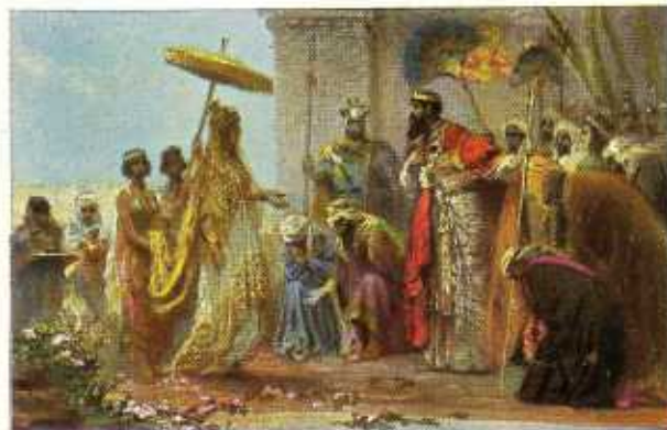
44. De koningin van Scheba bij Salomo