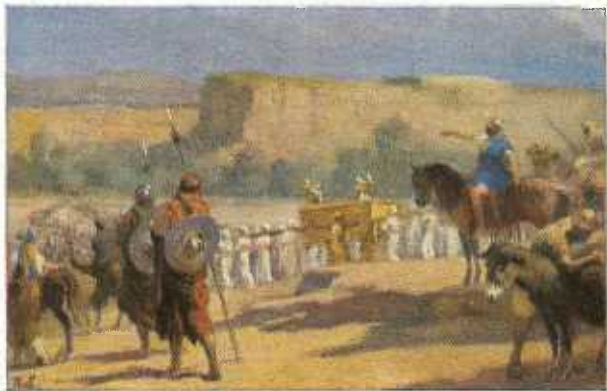
24. Israëel trekt door de Jordaan