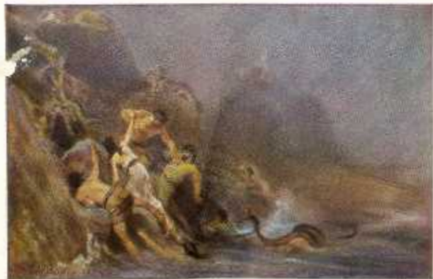
3. De Zondvloed